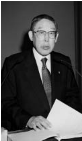
(文責) 国内広報部主任研究員 佐藤智徳