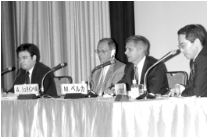
シンポジウムの模様